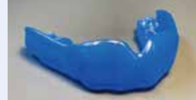
カスタムメイドのマウスガード例