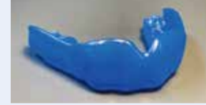
カスタムメイドのマウスガード例